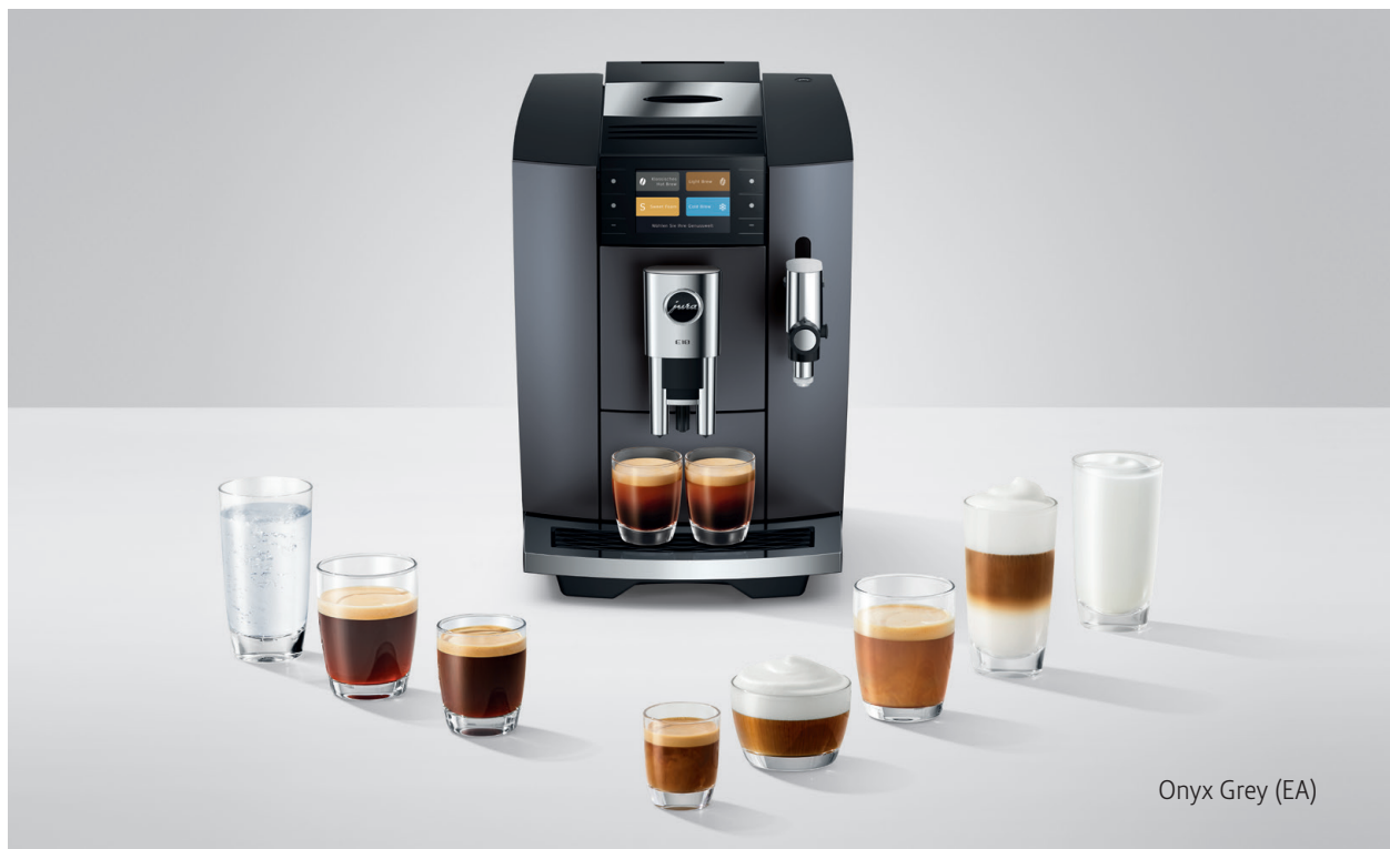
Onyx Grey (EA)